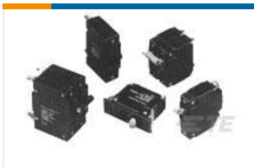
TE 产品编号3-1393253-8 W68-X2Q12-5=M6/M7/M9/W6/W7