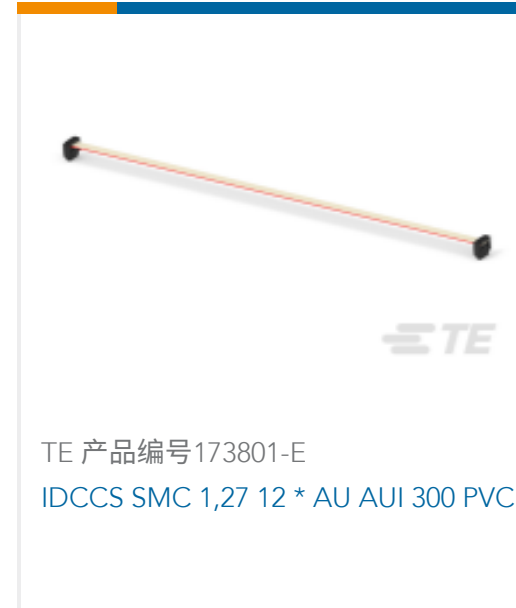
TE 产品编号173801-E IDCCS SMC 1,27 12 * AU AUI 300 PVC