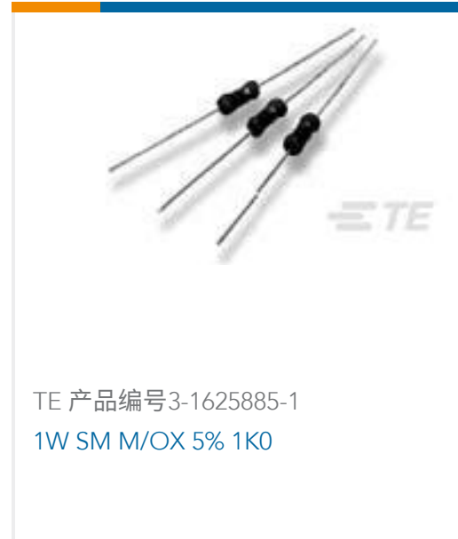
TE 产品编号3-1625885-1 1W SM M/OX 5% 1K0