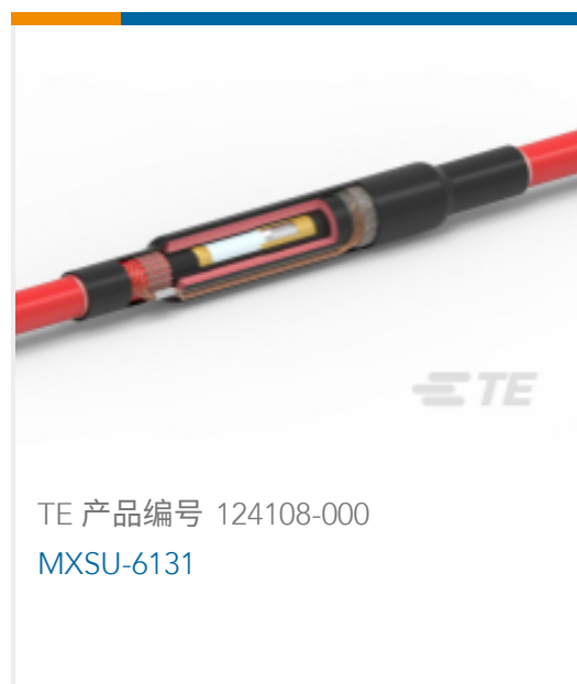
TE 产品编号 124108-000 MXSU-6131