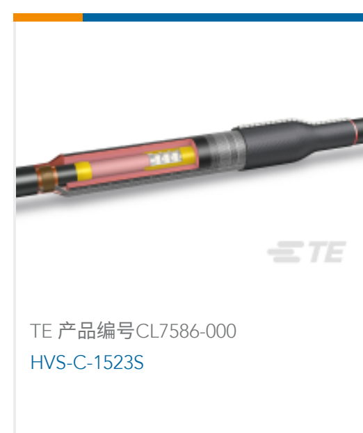
TE 产品编号CL7586-000 HVS-C-1523S