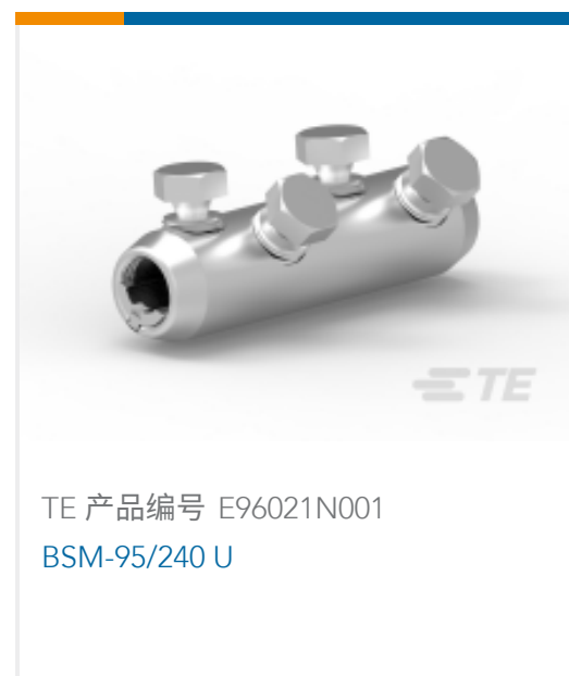
TE 产品编号 E96021N001 BSM-95/240 U