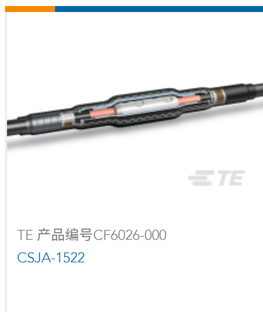
TE 产品编号CF6026-000 CSJA-1522