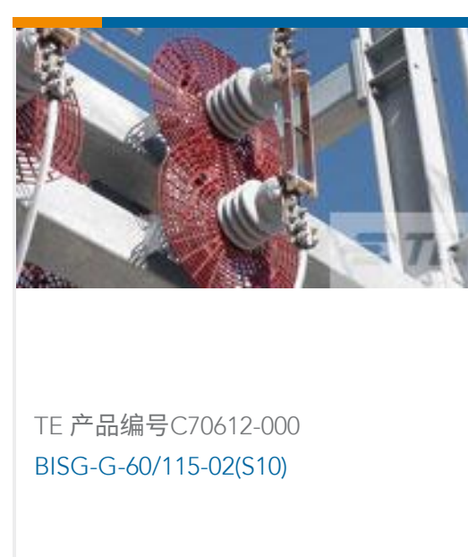
TE 产品编号C70612-000 BISG-G-60/115-02(S10)