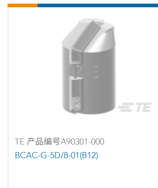
TE 产品编号A90301-000 BCAC-G-5D/8-01(B12)