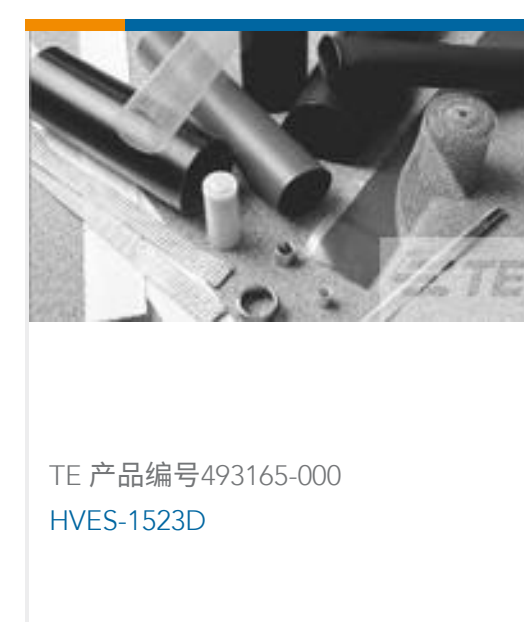
TE 产品编号493165-000 HVES-1523D