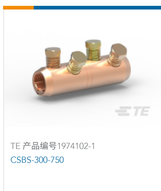
TE 产品编号1974102-1 CSBS-300-750