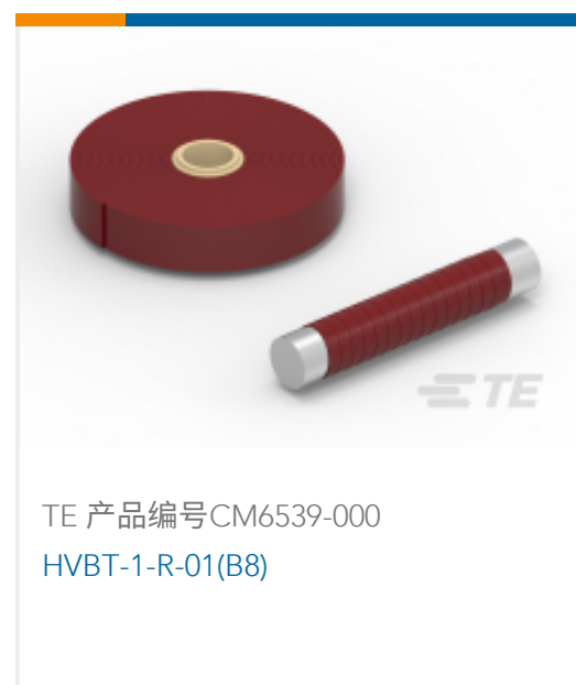
TE 产品编号CM6539-000 HVBT-1-R-01(B8)