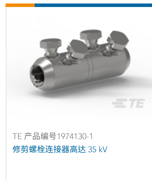
TE 产品编号1974130-1 修剪螺栓连接器高达 35 kV