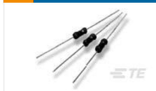
TE 产品编号5-1879353-9 RR02 1% 137R Ammo