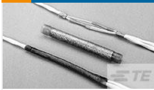
TE 产品编号946621-000 D-153-6002