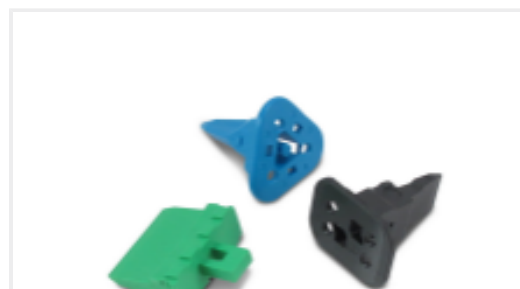
TE 产品编号CAT-D487-W416 Wedgelocks: DEUTSCH DT