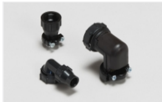
电路连接器后壳和夹具(2035)