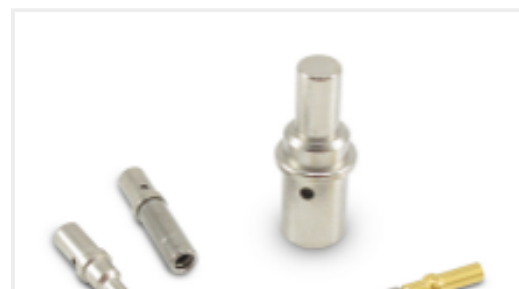
TE 产品编号CAT-D48-ST273 DEUTSCH Solid Contacts