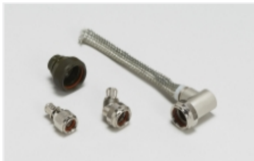
加固型后盖和适配器(2035)