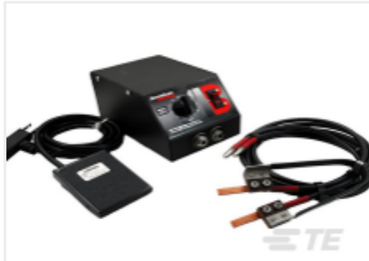
TE 产品编号 173643-000 RH-3960-1-TINEL-KIT-120V