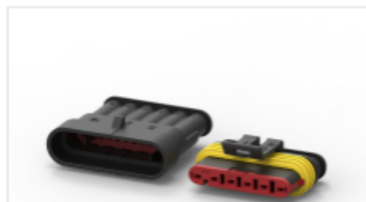
TE 产品编号CAT-AM71-CH8172 AMP SUPERSEAL 1.5MM, 连接器壳体