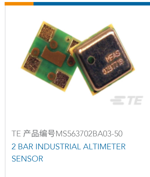
TE 产品编号MS563702BA03-50 2 BAR INDUSTRIAL ALTIMETER SENSOR