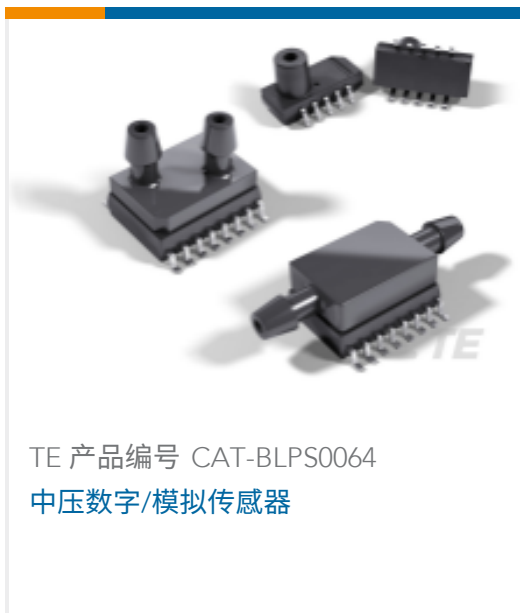
TE 产品编号 CAT-BLPS0064 中压数字/模拟传感器