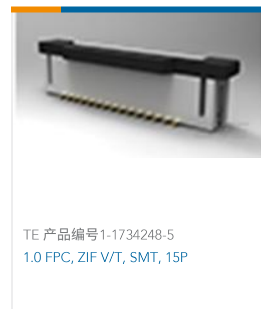
TE 产品编号1-1734248-5 1.0 FPC, ZIF V/T, SMT, 15P