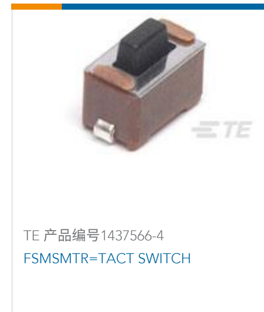
TE 产品编号1437566-4 FSMSMTR=TACT SWITCH