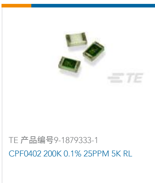
TE 产品编号9-1879333-1 CPF0402 200K 0.1% 25PPM 5K RL