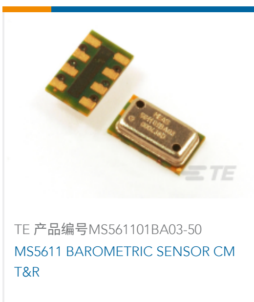
TE 产品编号MS561101BA03-50 MS5611 BAROMETRIC SENSOR CM T&R