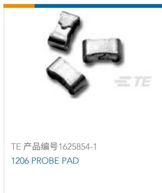
TE 产品编号1625854-1 1206 PROBE PAD