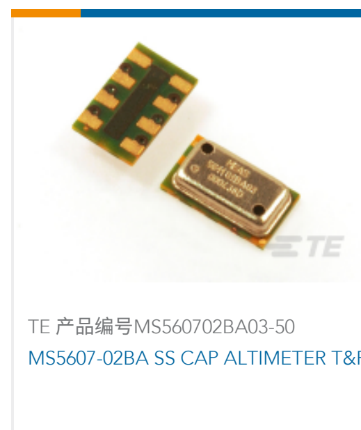
TE 产品编号MS560702BA03-50 MS5607-02BA SS CAP ALTIMETER T&R