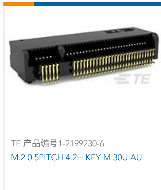
TE 产品编号1-2199230-6 M.2 0.5PITCH 4.2H KEY M 30U AU