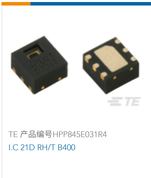
TE 产品编号HPP845E031R4 I.C 21D RH/T B400