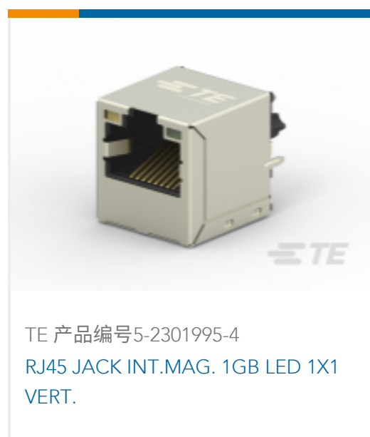
TE 产品编号5-2301995-4 RJ45 JACK INT.MAG. 1GB LED 1X1 VERT.