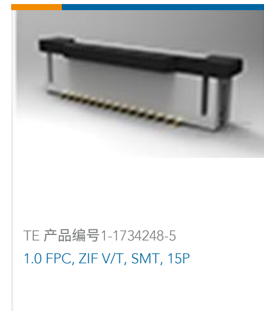
TE 产品编号1-1734248-5 1.0 FPC, ZIF V/T, SMT, 15P