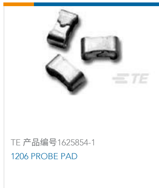
TE 产品编号1625854-1 1206 PROBE PAD