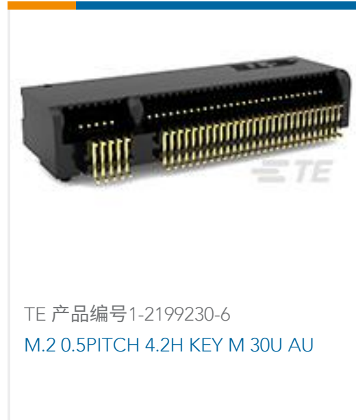
TE 产品编号1-2199230-6 M.2 0.5PITCH 4.2H KEY M 30U AU