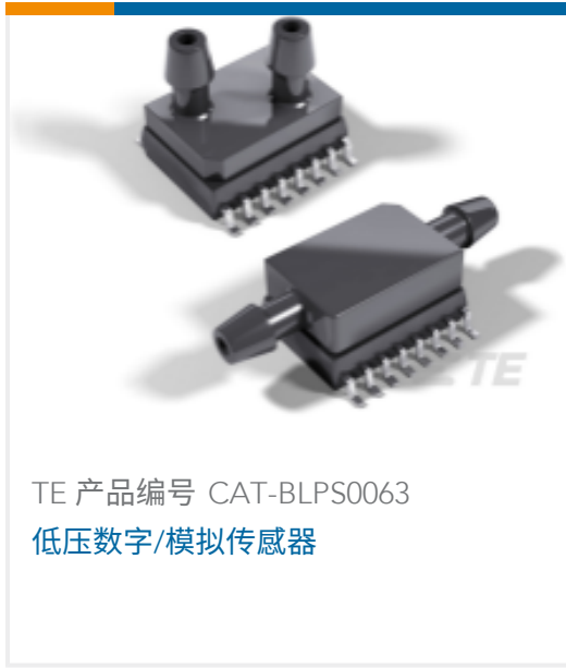
TE 产品编号 CAT-BLPS0063 低压数字/模拟传感器