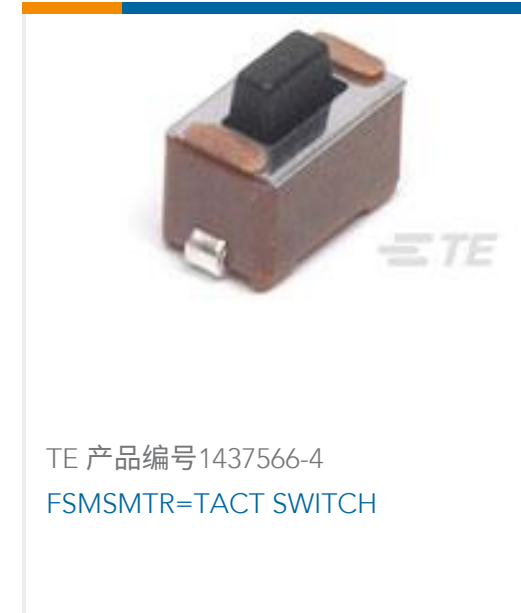
TE 产品编号1437566-4 FSMSMTR=TACT SWITCH