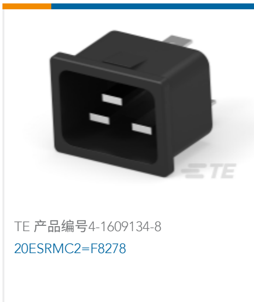
TE 产品编号4-1609134-8 20ESRMC2=F8278