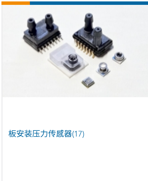
板安装压力传感器(17)