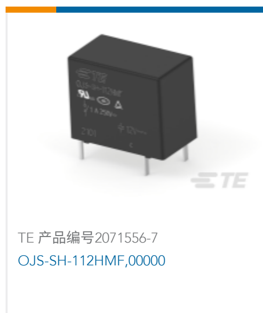
TE 产品编号2071556-7 OJS-SH-112HMF,00000