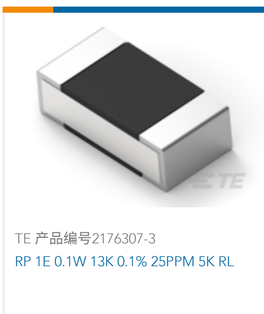
TE 产品编号2176307-3 RP 1E 0.1W 13K 0.1% 25PPM 5K RL