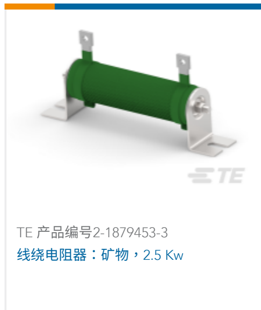
TE 产品编号2-1879453-3 线绕电阻器：矿物，2.5 Kw