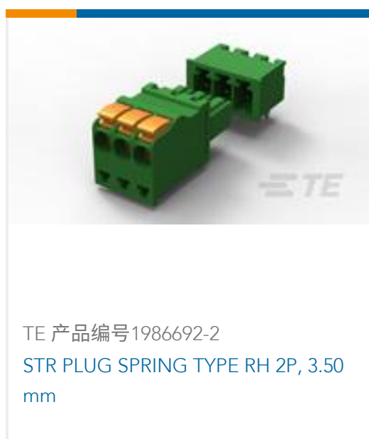
TE 产品编号1986692-2 STR PLUG SPRING TYPE RH 2P, 3.50 mm