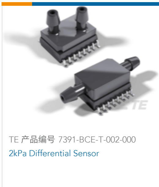
TE 产品编号 7391-BCE-T-002-000 2kPa Differential Sensor