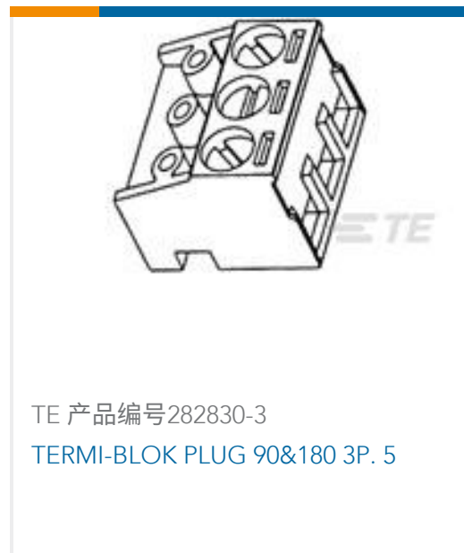
TE 产品编号282830-3 TERMI-BLOK PLUG 90&180 3P. 5