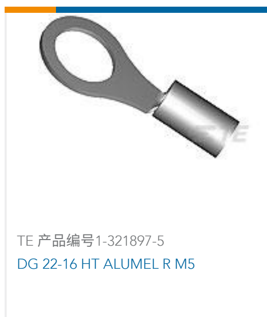
TE 产品编号1-321897-5 DG 22-16 HT ALUMEL R M5