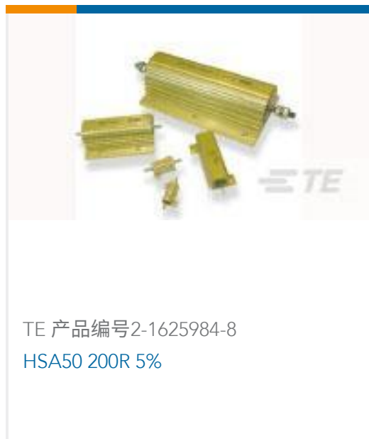
TE 产品编号2-1625984-8 HSA50 200R 5%