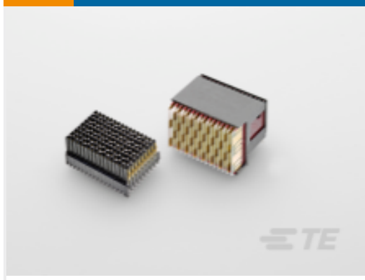
TE 产品编号2302790-1 VERTRECASSY,RIGHTEND,MULTIGIG RT3