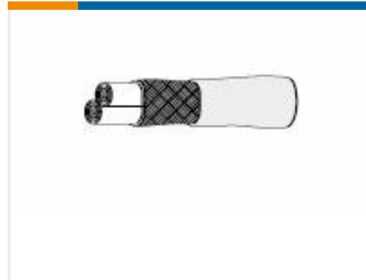
TE 产品编号955741-000 55PC1121-22-6/9-9