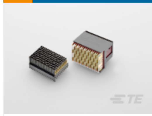
TE 产品编号2302791-1 VERTRECASSY,CENTER,RTM, MULTIGIG RT3