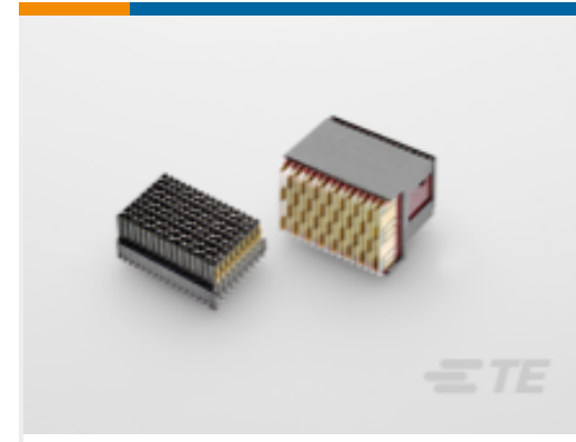
TE 产品编号2302788-1 VERTRECASSY,LEFTEND, HALF, MGRT3