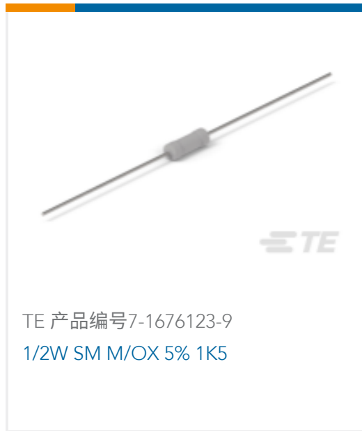
TE 产品编号7-1676123-9 1/2W SM M/OX 5% 1K5