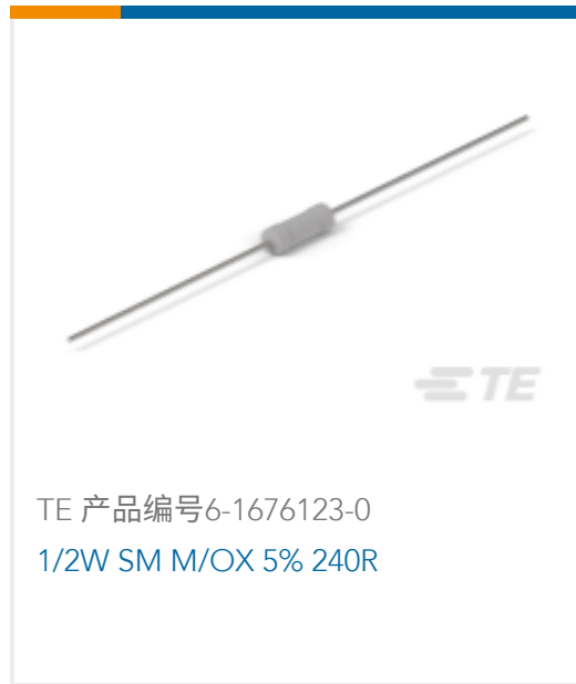
TE 产品编号6-1676123-0 1/2W SM M/OX 5% 240R