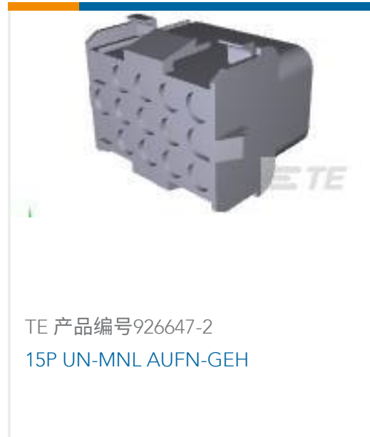
TE 产品编号926647-2 15P UN-MNL AUFN-GEH