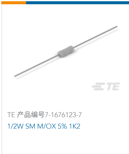
TE 产品编号7-1676123-7 1/2W SM M/OX 5% 1K2