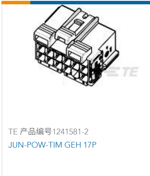
TE 产品编号1241581-2 JUN-POW-TIM GEH 17P