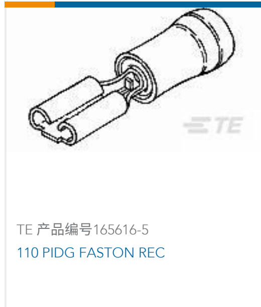
TE 产品编号165616-5 110 PIDG FASTON REC