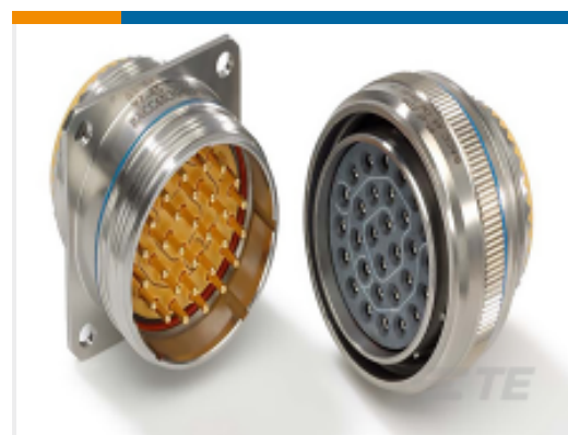
TE 产品编号ZPF000000000105618 983-6R 08-03 SN-A246