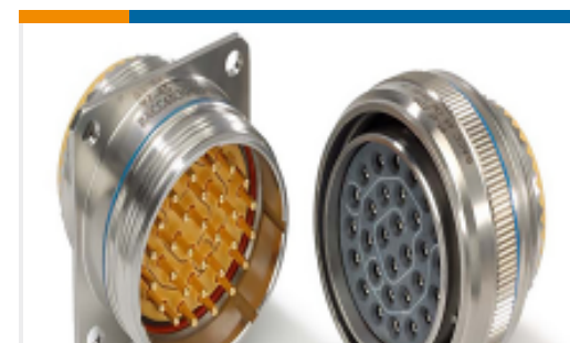
TE 产品编号ZPF000000000007308 983-0S 08-03 PN