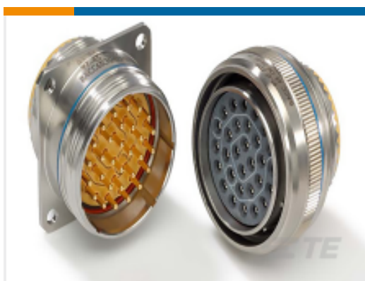
TE 产品编号ZPF000000000007358 983-0S 12-12 PN