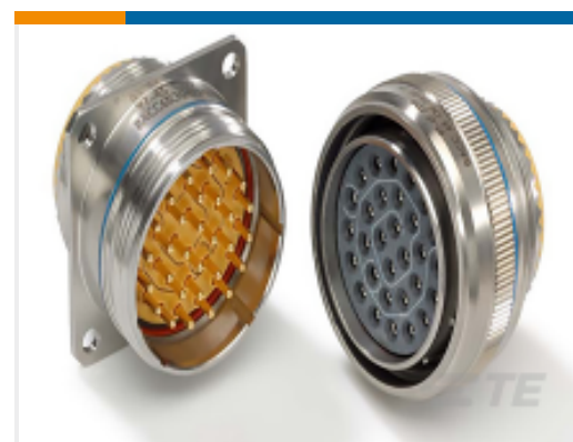
TE 产品编号ZPF000000000105746 983-6R 10-05 SN-A246