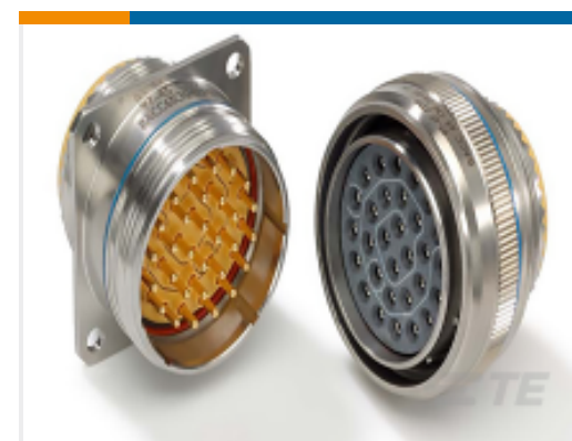
TE 产品编号ZPF000000000008584 983-6S 12-12 PN