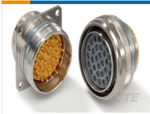
TE 产品编号ZPF000000000008882 983-6SE 16-24 P6 L