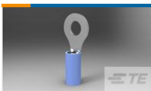
TE 产品编号8-320563-1 TERMINAL,PIDG R 16-14 1/4