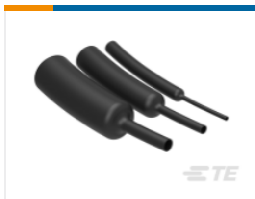
TE 产品编号6893036001 RNF-3000 Heat Shrink Tubing