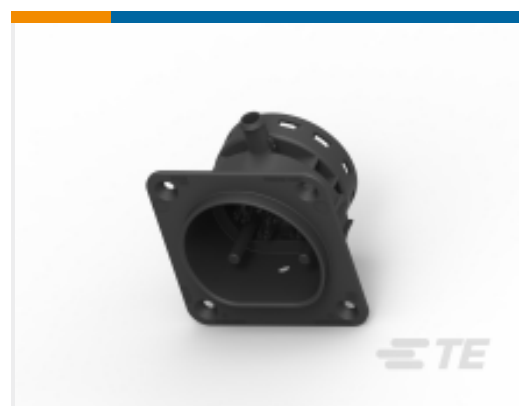
TE 产品编号2177786-3 5POS, MIXED,HSG, IEC62196-2 TYPE 2,Top