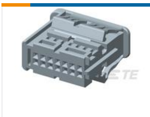
TE 产品编号2208340-1 14POS,NANOMQS,REC HSG,CODA