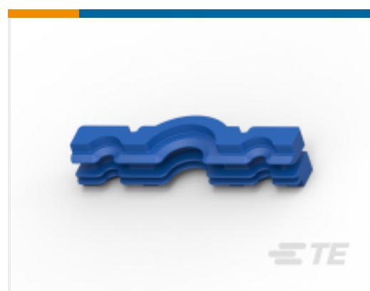
TE 产品编号9-2177861-1 FAMILY SEAL, MIXED, BU, Vers.1