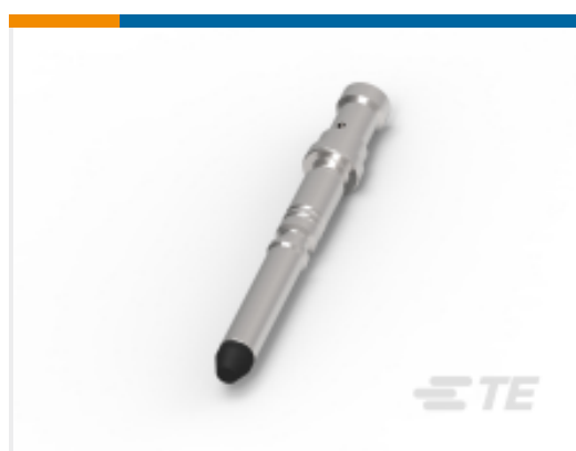
TE 产品编号9-2177815-3 PIN DIA 3.6, L/N, ASSY