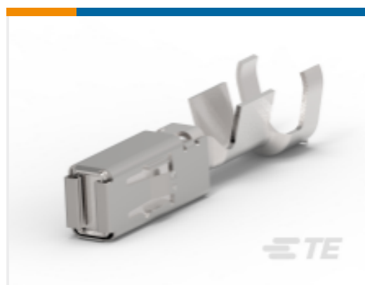
TE 产品编号2-968859-3 AMP MCP 2.8, CONTACT SWS