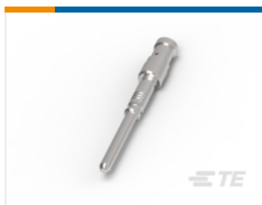
TE 产品编号9-2177817-3 PIN DIA 2.8, PE