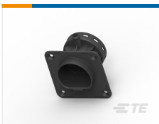
TE 产品编号2208383-1 5POS, MIXED,HSG,INLET GB