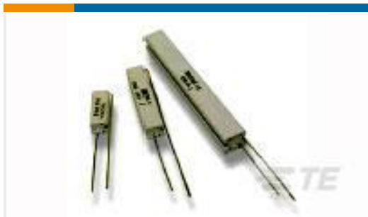
TE 产品编号1623730-4 BCHE 4 W 15R 5%