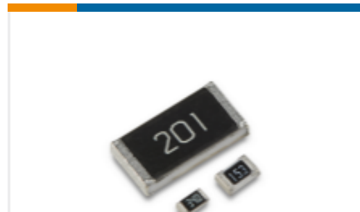
TE 产品编号3-2176328-6 CRGP 1206 8K2 1%