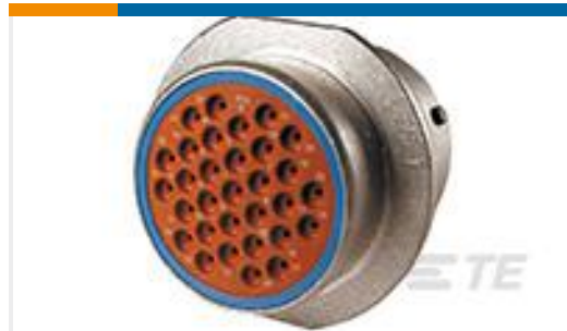
TE 产品编号HD34-24-31PE REC, 31P, AL, E, 16, P