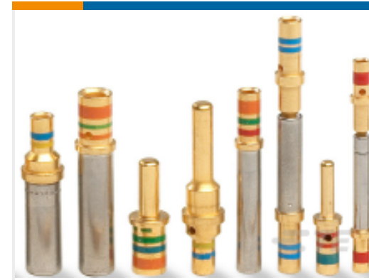
TE 产品编号0660-206-1631L CONT PIN