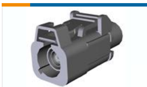
TE 产品编号776682-2 Plug Kit, RG-59, Fakra, 180 Deg, Unassem