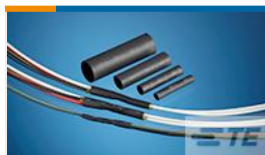
TE 产品编号2525596025 RBK-ILS-125-NR1-0-80MM