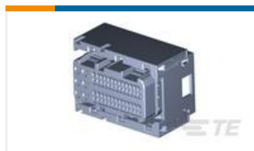
TE 产品编号9-1452415-7 58 POS MIXED, MCON CONNECTOR