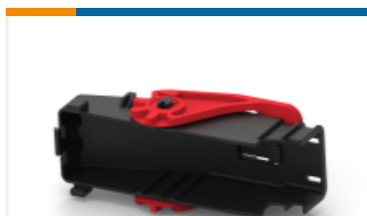
TE 产品编号2035037-1 WIRE DRESS ASSY, 96P LOW PROFI