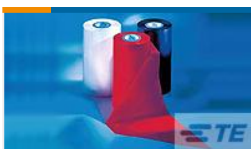
TE 产品编号F55931-000 1966-RIBBON