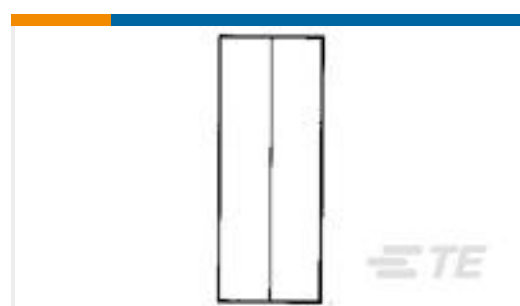
TE 产品编号34130 SPLICE,SOLIS PARA 22-16