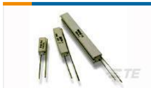
TE 产品编号3-1623732-4 BCHE 7 W 3K3 5%