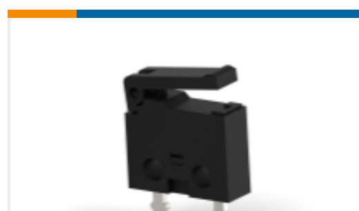
TE 产品编号2351460-2 MINSA SW HLV 0.30N 0.5A AC NC UnPtch