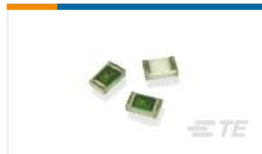
TE 产品编号1676443-2 RN 0805 825R 0.1% 10PPM 1KRL