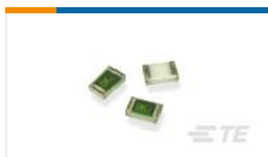
TE 产品编号3-2176088-6 RP 1J 0.166W 1K82 0.1% 25PPM 1K RL