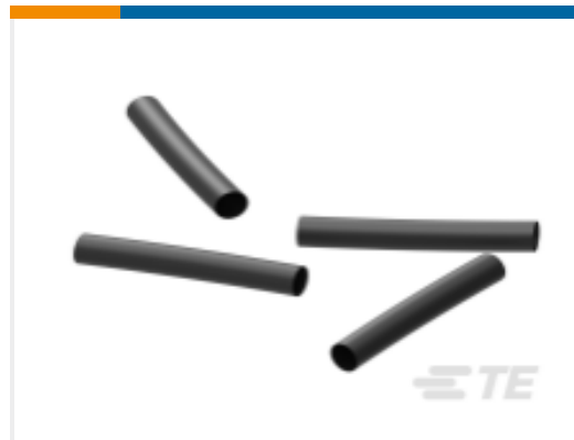
TE 产品编号EK5495-000 ES2000-NO.3-B8-8L-45MM