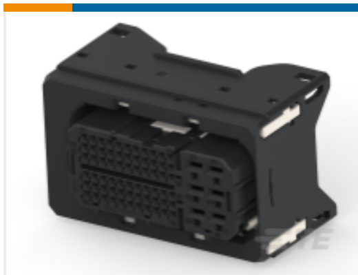
TE 产品编号2040115-2 0.50/1.0/2.8 SEALED PLUG ASSY 72POS