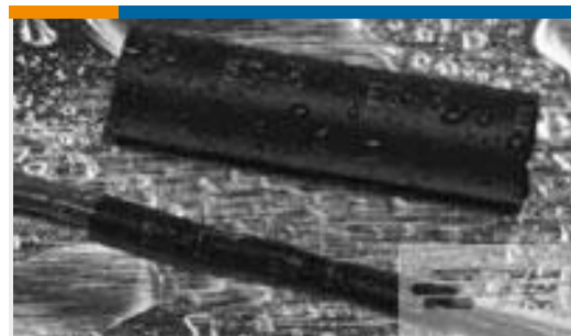
TE 产品编号121397P067 ES2000-NO.3-B8-0-25MM