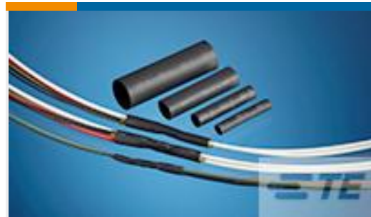
TE 产品编号7501716011 RBK-ILS-125-NR4-0-30MM