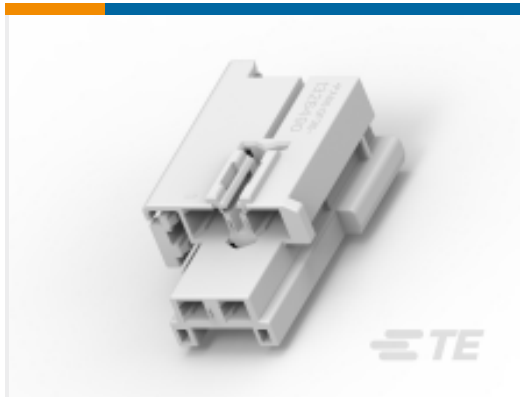
TE 产品编号1326490-5 4P JPT/MT3 PLUG W/LATCH, NATURAL