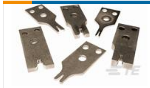
TE 产品编号1276120-3 CRIMPER, INSULATION