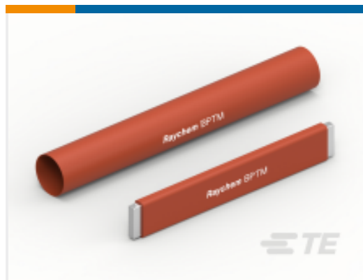
TE 产品编号412147-000 母线热缩管高达 24 kV