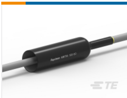
TE 产品编号122998-000 MWTM-180/60-1000/S(S5)