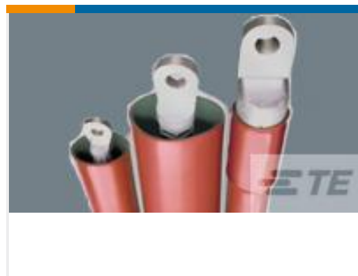
TE 产品编号362020-000 IXSU-F6151