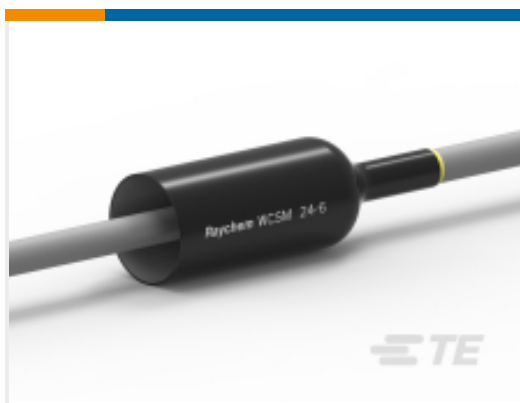
TE 产品编号CU9291-000 WCMS-24/6-1200/S