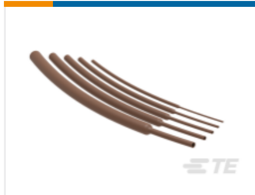
TE 产品编号5053114035 RNF-100-1 热缩管