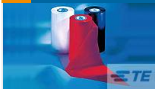
TE 产品编号742412-000 1330-0607-10