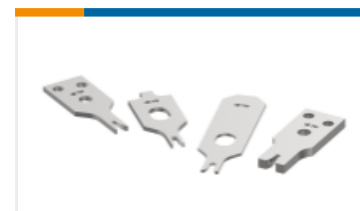
TE 产品编号3-1633962-3 CRIMPER, INSULATION F PREMIUM