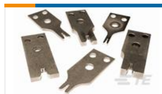
TE 产品编号1-2119582-0 Crimper, Insulation F Premium