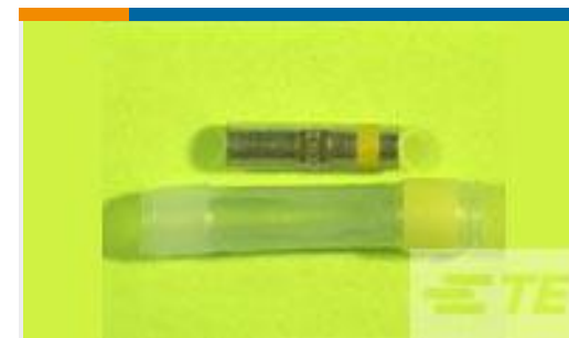
TE 产品编号650099-000 D-436-76