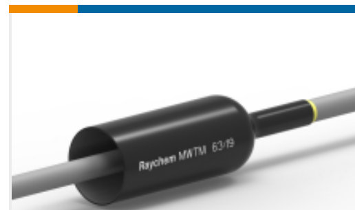
TE 产品编号102140-000 MWTM-63/19-1500/S