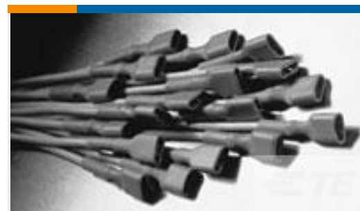
TE 产品编号4847054001 LSTT-12.7-0-SP