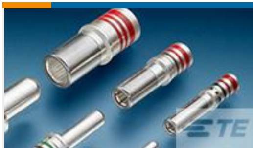
TE 产品编号 0662-207-0082 CONT SOC ASSY