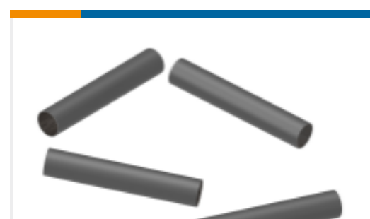
TE 产品编号NB25962001 SCL-1/4-0-STK