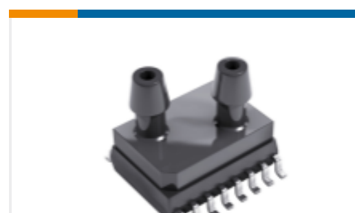
TE 产品编号9541-100C-D-C-3-S PRESSURE I2C 1.5 PSID SO16