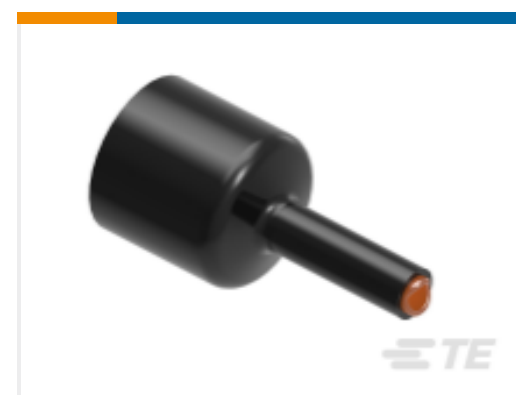
TE 产品编号 CAT-HST-QS1500 QS1500 热缩管