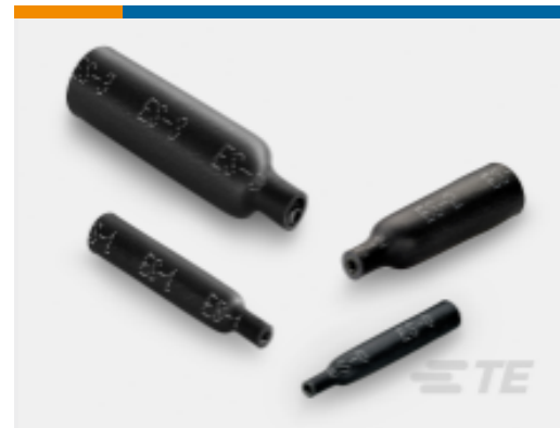
TE 产品编号 CAT-HSC-ESCAP1 接头密封端盖（ES帽）