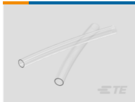
TE 产品编号 CAT-HST-ES1000 ES1000 热缩管