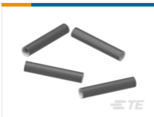
TE 产品编号 CAT-HST-FL2500 FL2500 热缩管