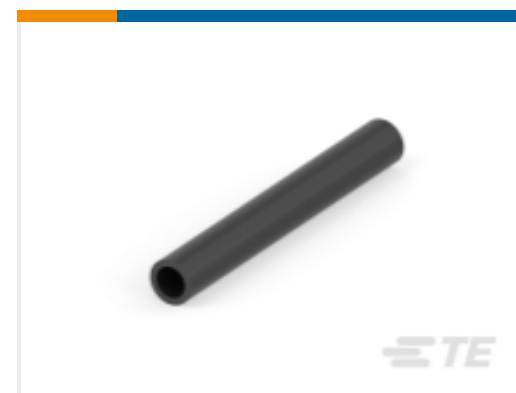
TE 产品编号 CAT-HST-RT3 RT-3 热缩管