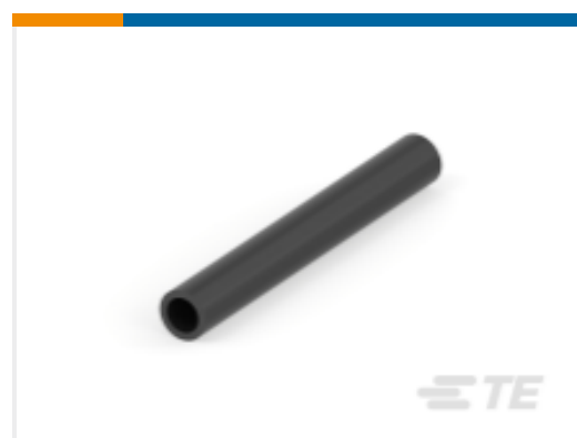
TE 产品编号 CAT-HST-RBKILS RBK-ILS 热缩管