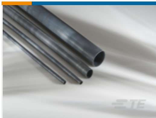
TE 产品编号 CAT-HST-DWFR DWFR 热缩管