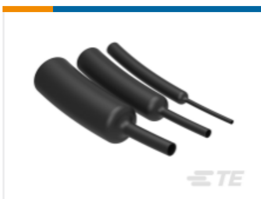
TE 产品编号 5677576049 RNF-3000-6/2-0-40MM