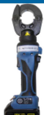
TE 产品编号 2107725-1 AUTOPRESS L62+ COF+CHARG