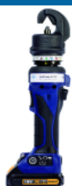
TE 产品编号 2107475-2 UNIPRESS 6/120 +COF+CHARG