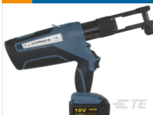
TE 产品编号 2107730-1 AutoPress 80 18V+COF+CHARG