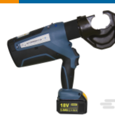
TE 产品编号 2107733-4 AUTOPRESS C120 18V+COF+CHARG 110V