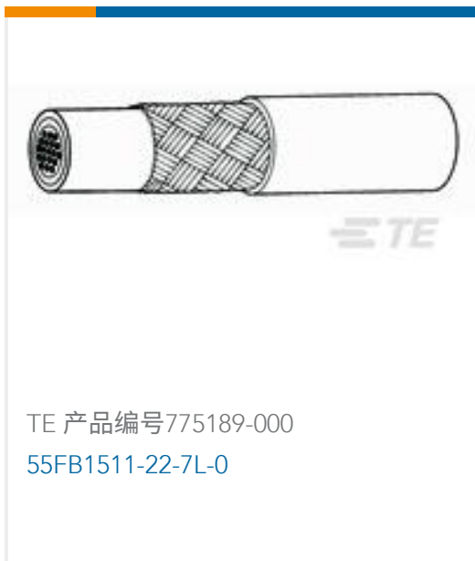
TE 产品编号775189-000 55FB1511-22-7L-0