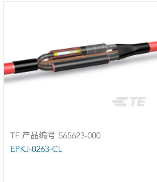
TE 产品编号 565623-000 EPKJ-0263-CL