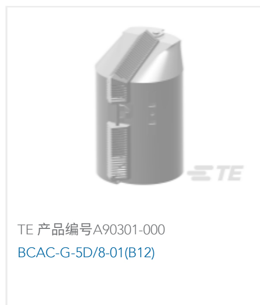
TE 产品编号 A90301-000 BCAC-G-5D/8-01(B12)