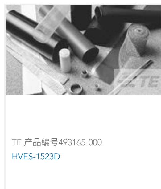
TE 产品编号 493165-000 HVES-1523D