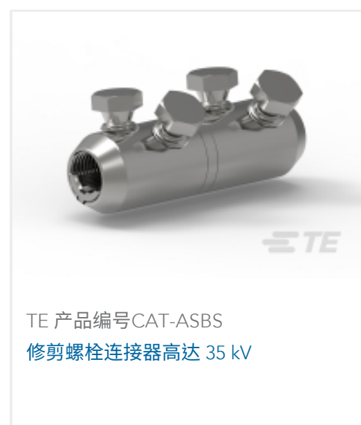
TE 产品编号 CAT-ASBS 修剪螺栓连接器高达 35 kV