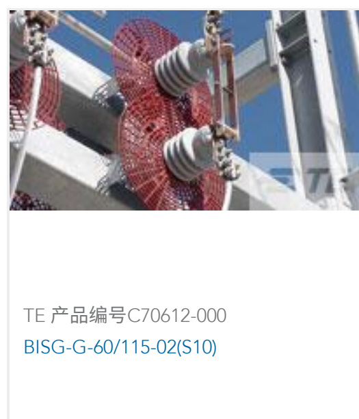
TE 产品编号 C70612-000 BISG-G-60/115-02(S10)