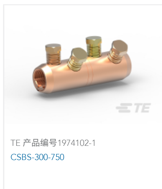
TE 产品编号 1974102-1 CSBS-300-750