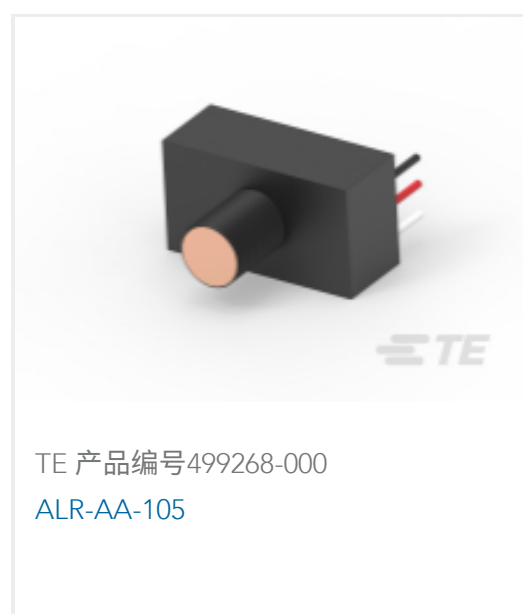
TE 产品编号 499268-000 ALR-AA-105