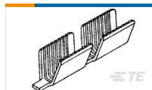
TE 产品编号62001-1 SPLICE AMVAR 3000-7000 020BR