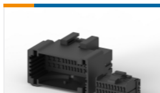
TE 产品编号638100-1 MULTILOCK, 连接器壳体