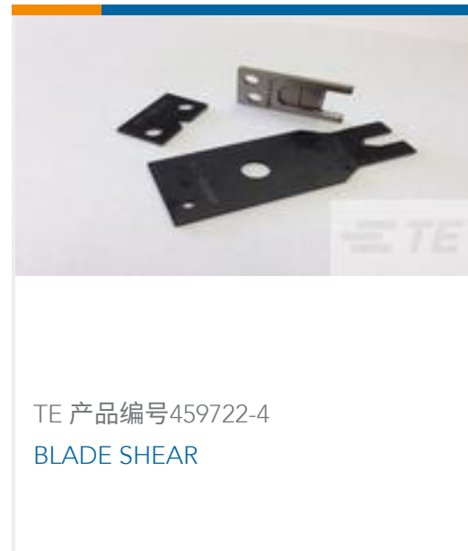
TE 产品编号459722-4 BLADE SHEAR