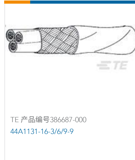
TE 产品编号386687-000 44A1131-16-3/6/9-9