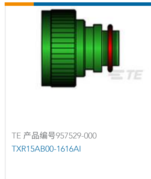
TE 产品编号957529-000 TXR15AB00-1616AI