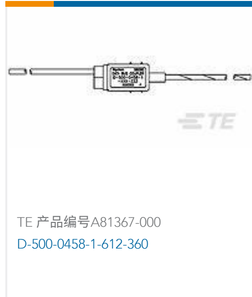
TE 产品编号A81367-000 D-500-0458-1-612-360