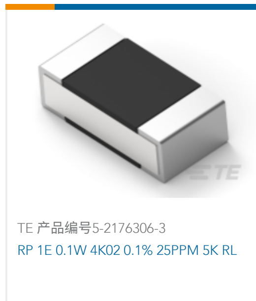
TE 产品编号5-2176306-3 RP 1E 0.1W 4K02 0.1% 25PPM 5K RL