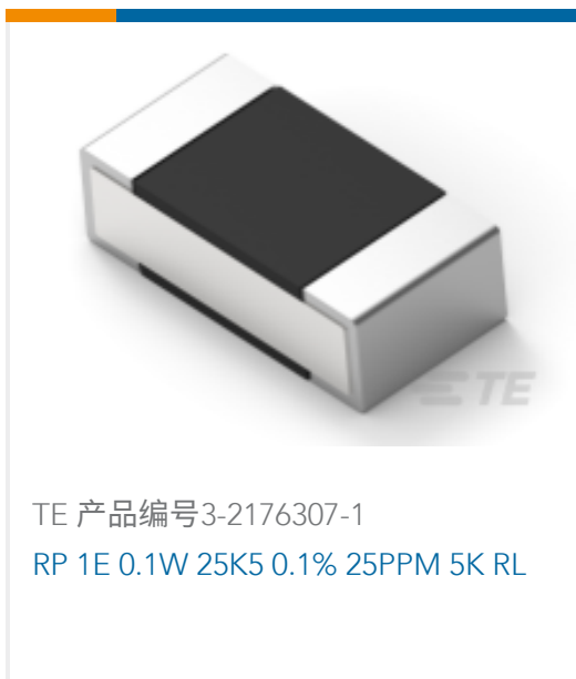
TE 产品编号3-2176307-1 RP 1E 0.1W 25K5 0.1% 25PPM 5K RL