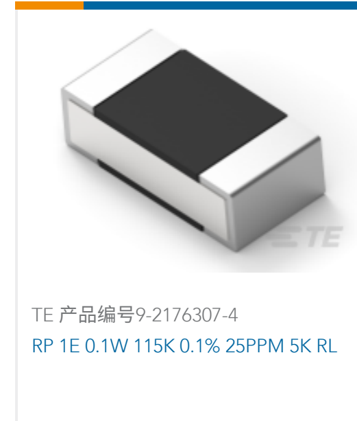
TE 产品编号9-2176307-4 RP 1E 0.1W 115K 0.1% 25PPM 5K RL