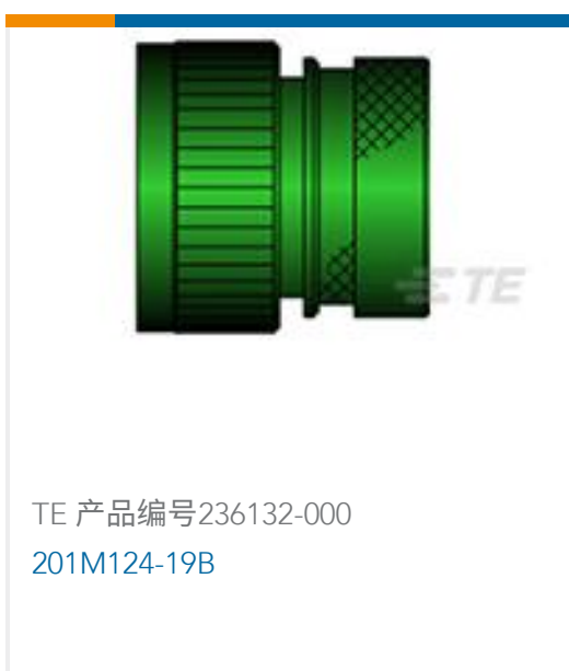
TE 产品编号236132-000 201M124-19B