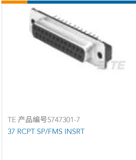
TE 产品编号5747301-7 37 RCPT SP/FMS INSRT