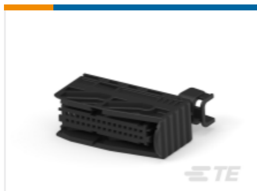
TE 产品编号7-967312-4 30POS MQS REC COD A