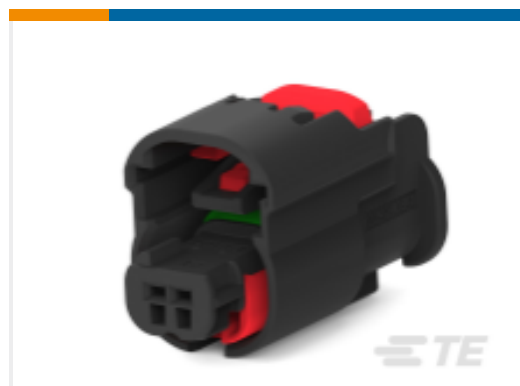
TE 产品编号2292906-2 2POS,MCON 1.2,REC HSG ASSY,SLD, COD B