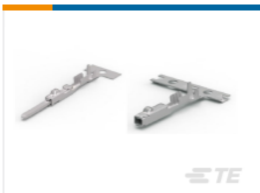
TE 产品编号1718348-3 MCON Receptacle and Tab