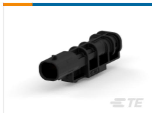
TE 产品编号2292937-2 2POS,1.2X0.6,TAB HSG ASSY,SLD, COD B