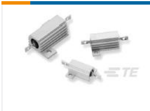
TE 产品编号1-1879071-8 THS50 3R3 5%