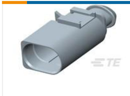
TE 产品编号1-1703543-0 2POS,TAB 2.8X0.8,TAB HSG,ASSY