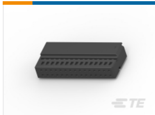
TE 产品编号965543-3 30POS MQS REC COD A