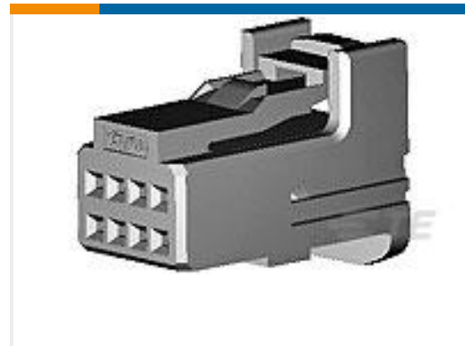
TE 产品编号1379659-2 8W PLUG HOUSING ASSY GRAY