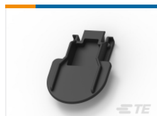
TE 产品编号968822-3 SICHERUNGSPLATTE