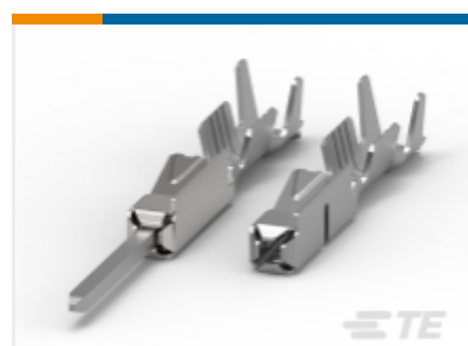
TE 产品编号1241603-1 MQS, 母端和公端