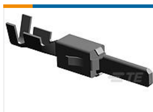
TE 产品编号2-964296-1 TAB A 2.8x0.8 CONTACT CF SRC Sn