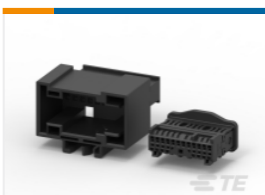
TE 产品编号1534101-1 MQS 连接器外壳