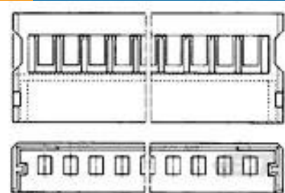
TE 产品编号 1-917572-1 1.5 B-T-W PLUG HSG 11P BLACK