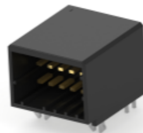
TE 产品编号1318126-1 Dynamic 2000 HDR 组件