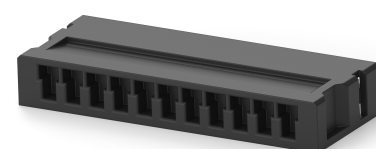
TE 产品编号 2069390-1 PLUG HSG, 1.5VP REMODEL 11P