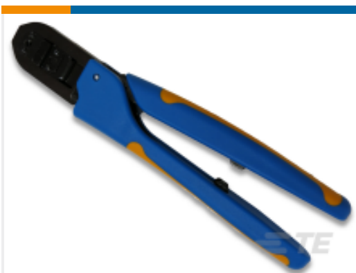
TE 产品编号 91516-1 CCII MOD IV REC 30-20 ASSY