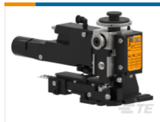
TE 产品编号 2266813-2 OCEAN_2.0_Applicator-S-055F062FA