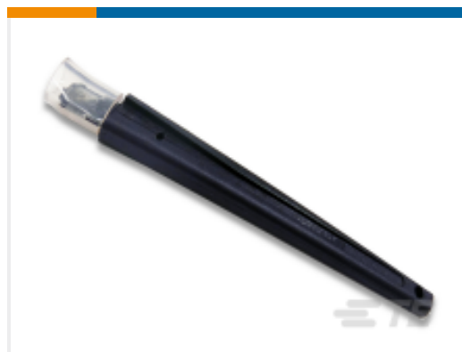
TE 产品编号 843996-3 TOOL, EXTRACTION RESET