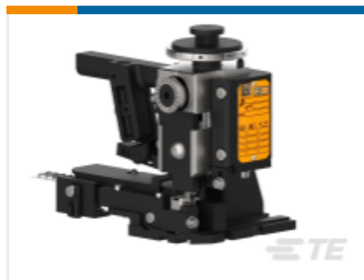
TE 产品编号 2266813-1 OCEAN_2.0_Applicator-S-055F062F-RSM