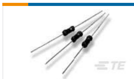
TE 产品编号9-1879352-1 RR02 5% 1K8 AMMO