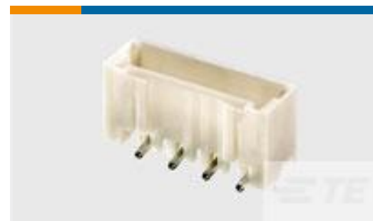
TE 产品编号292231-3 1.5 MINI CT SGL V SMT W/O BOSS