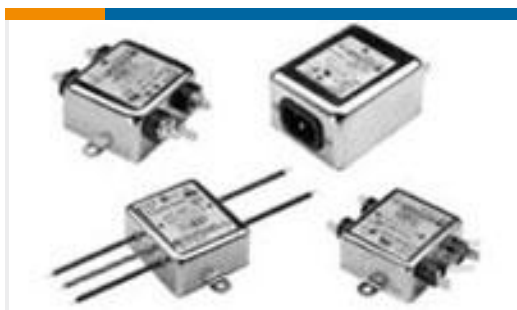
TE 产品编号1-6609027-5 10EK7=F7095 S0