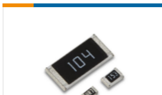
TE 产品编号2176347-6 CRGCQ 2010 27R 1%