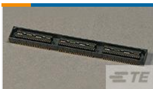
TE 产品编号2-1658012-3 MSB0.80RC-ASY120FL-,10,-TY