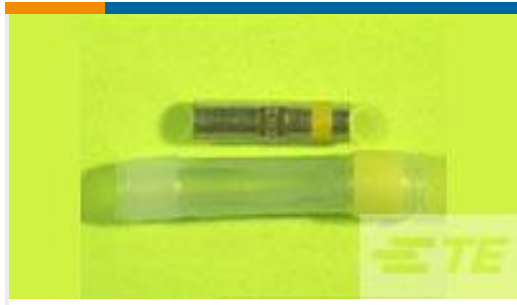
TE 产品编号650126-000 D-436-82