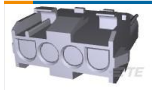
TE 产品编号926305-6 UNML4WAY CAP