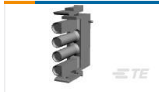
TE 产品编号926298-6 UNML PLUG 4WAY