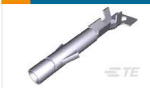
TE 产品编号926884-3 UNIV.M-M-L.SOCKET