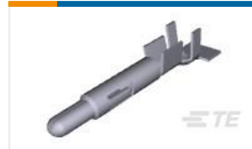
TE 产品编号926887-3 UNIV.M-N-L.PIN