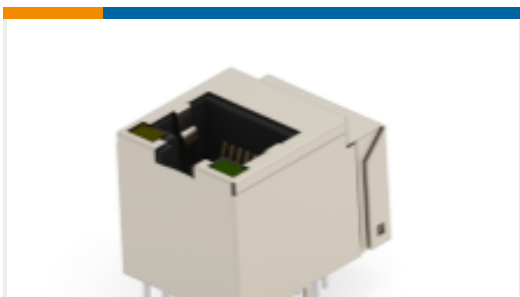
TE 产品编号203342-E MJIM IMV 1X1 S 810 * X R THRU * L1A M5B0