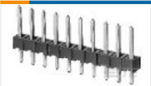
TE 产品编号5-146280-3 03 MODII HDR SRST B/A .100CL