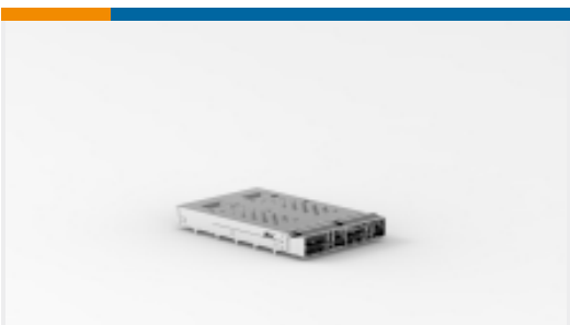
TE 产品编号2170805-4 CAGE ASSEMBLY, 1X2, QSFP28, SPRING