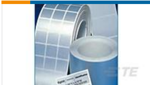
TE 产品编号A57045-000 WP-165051-25-9