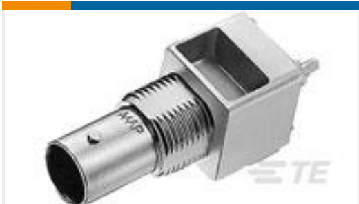
TE 产品编号5222132-1 JACK,VERTICAL,PCB,75 OHM,BNC