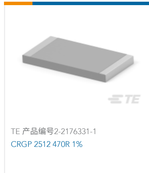
TE 产品编号2-2176331-1 CRGP 2512 470R 1%