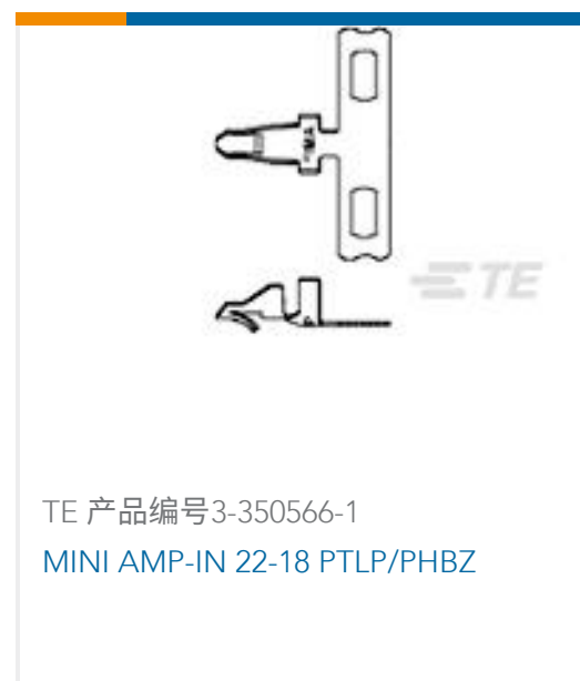
TE 产品编号3-350566-1 MINI AMP-IN 22-18 PTLP/PHBZ