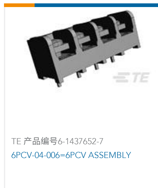
TE 产品编号6-1437652-7 6PCV-04-006=6PCV ASSEMBLY