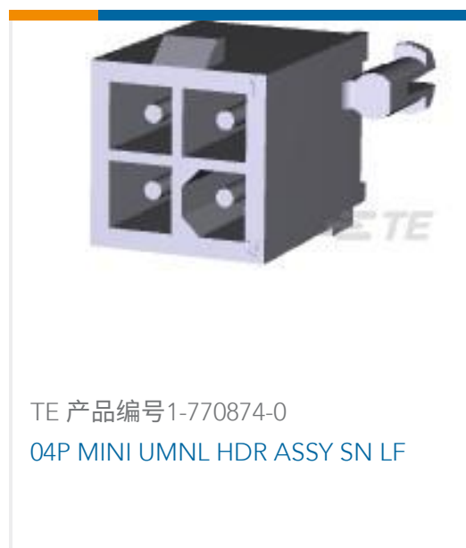
TE 产品编号1-770874-0 04P MINI UMNL HDR ASSY SN LF