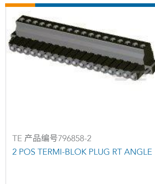
TE 产品编号796858-2 2 POS TERMI-BLOK PLUG RT ANGLE