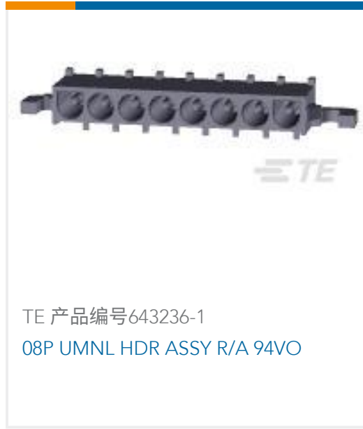
TE 产品编号643236-1 08P UMNL HDR ASSY R/A 94VO