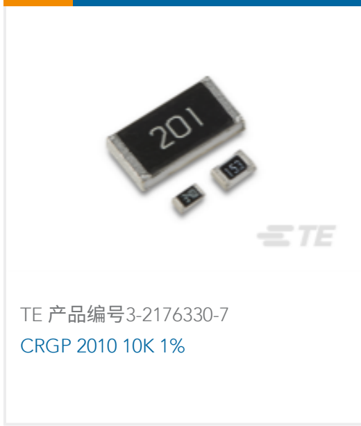
TE 产品编号3-2176330-7 CRGP 2010 10K 1%