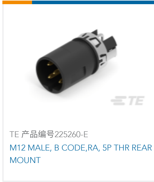
TE 产品编号225260-E M12 MALE, B CODE,RA, 5P THR REAR MOUNT