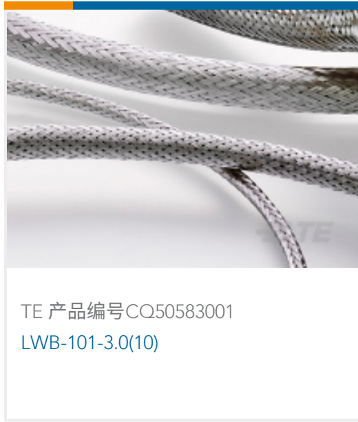
TE 产品编号CQ50583001 LWB-101-3.0(10)