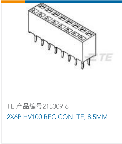
TE 产品编号215309-6 2X6P HV100 REC CON. TE, 8.5MM