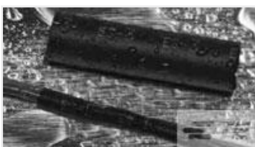
TE 产品编号121397P013 ES2000-NO.3-B8-0-41MM