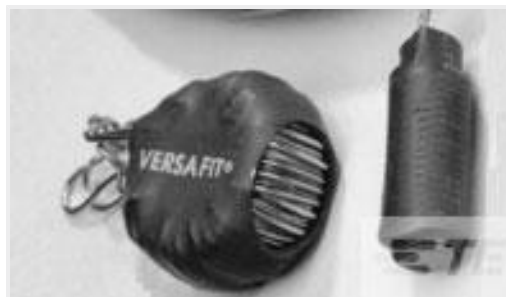
TE 产品编号CZ8200-000 VERSAFIT-3/4-0-2.25IN