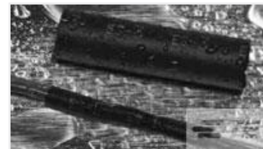
TE 产品编号CX2740-000 ES2000-NO.3-B8-0-130MM