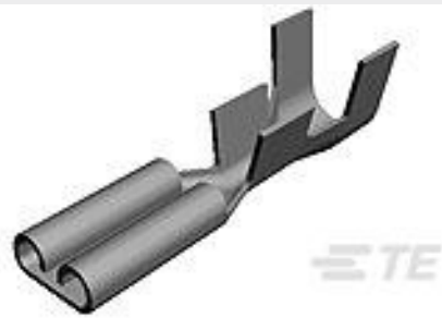
TE 产品编号62865-1 187 FASTON REC 20-16 AWG TPBR