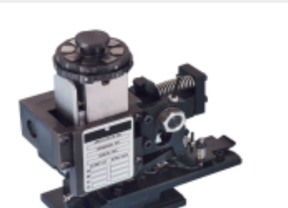
TE 产品编号680588-3 HDM 9HBAPR1405140OG