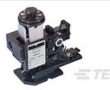
TE 产品编号567408-2 HDMHB 9EAPR160T180O G