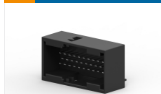
TE 产品编号967387-1 29pos header 180deg PF AP