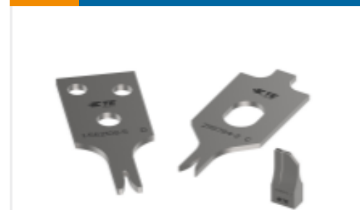
TE 产品编号7-2836012-7 OC-091F149O-CRIMPTOOLINGKIT