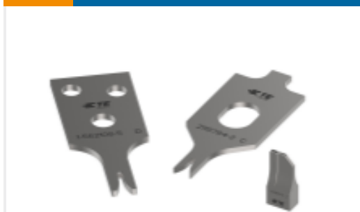
TE 产品编号7-2266989-7 OCEAN_2.0_SPARE_PART_KIT-111F154O