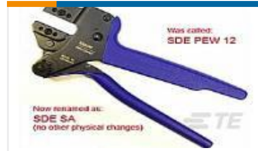
TE 产品编号2063524-1 SDE MCP1.5 0.2-1.0mm2 ASSY