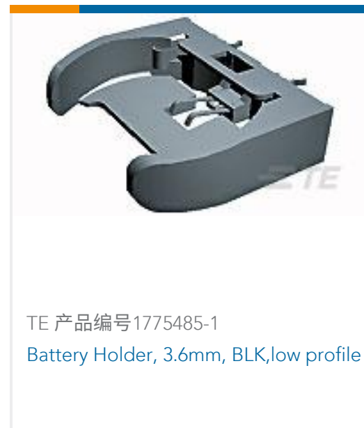
TE 产品编号1775485-1 Battery Holder, 3.6mm, BLK,low profile