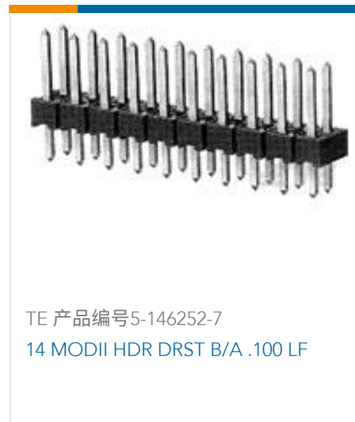
TE 产品编号5-146252-7 14 MODII HDR DRST B/A .100 LF