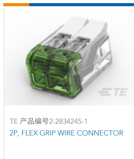
TE 产品编号2-2834245-1 2P, FLEX GRIP WIRE CONNECTOR