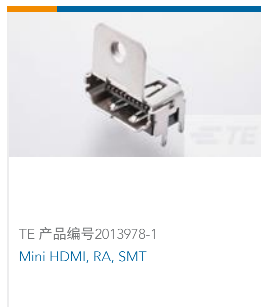
TE 产品编号2013978-1 Mini HDMI, RA, SMT