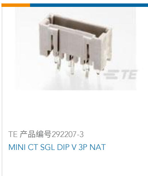
TE 产品编号292207-3 MINI CT SGL DIP V 3P NAT