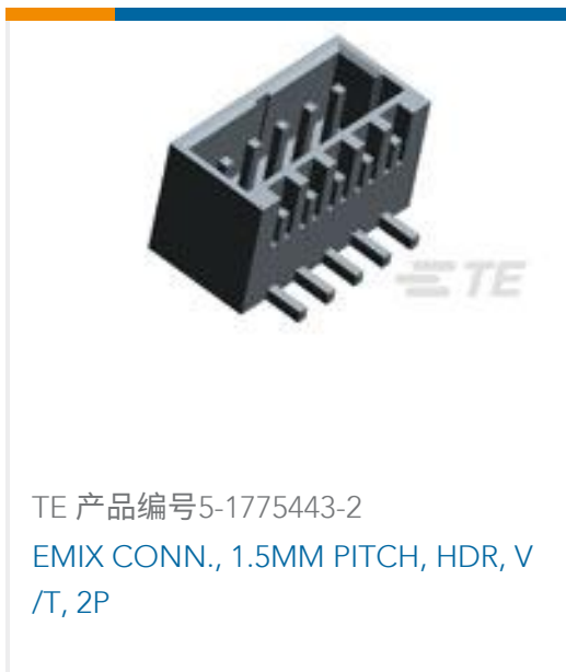
TE 产品编号5-1775443-2 EMIX CONN., 1.5MM PITCH, HDR, V /T, 2P