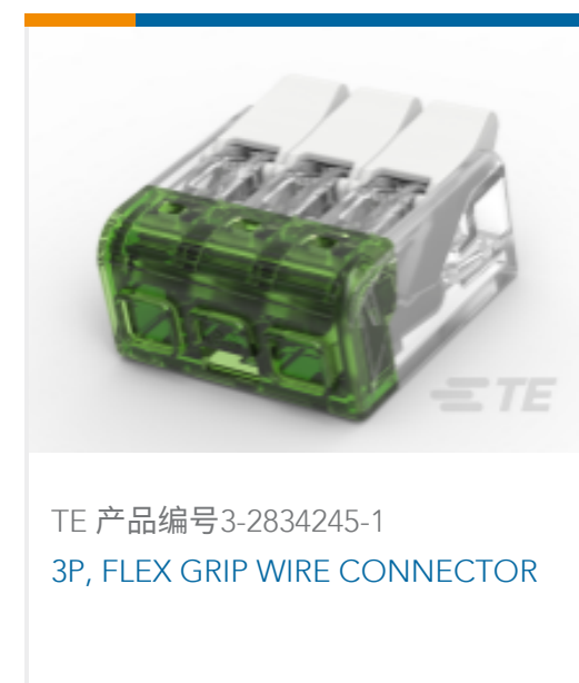
TE 产品编号3-2834245-1 3P, FLEX GRIP WIRE CONNECTOR