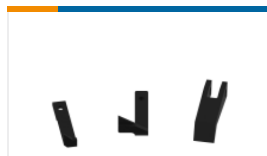
TE 产品编号458537-2 FEED PAWL