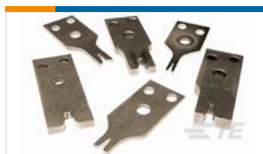
TE 产品编号1-456408-3 CRIMPER WIRE .110 F