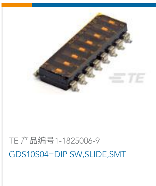
TE 产品编号1-1825006-9 GDS10S04=DIP SW,SLIDE,SMT