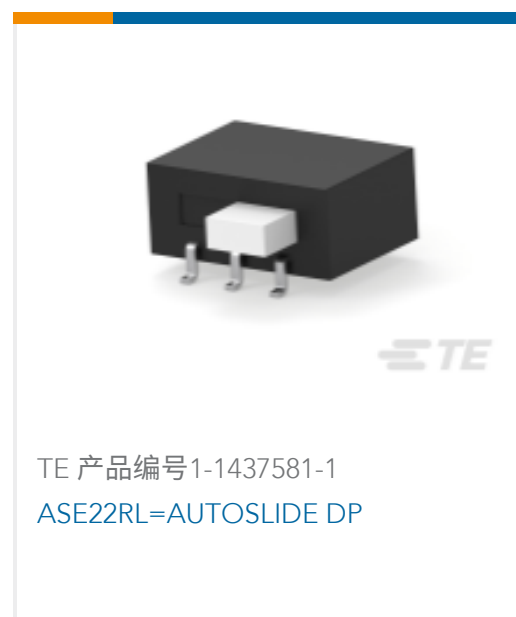
TE 产品编号1-1437581-1 ASE22RL=AUTOSLIDE DP