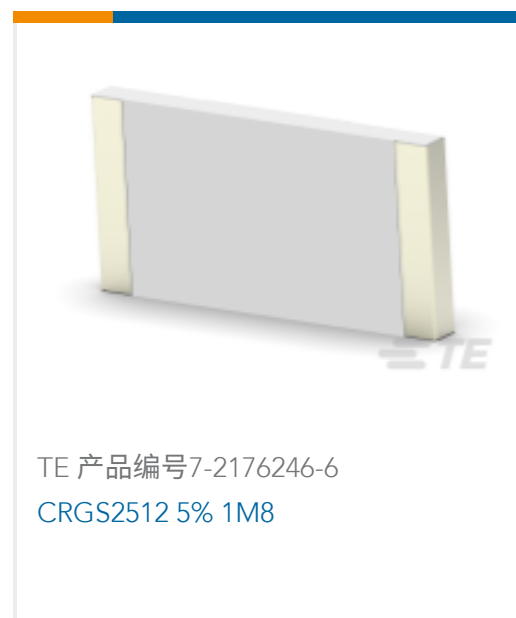
TE 产品编号7-2176246-6 CRGS2512 5% 1M8