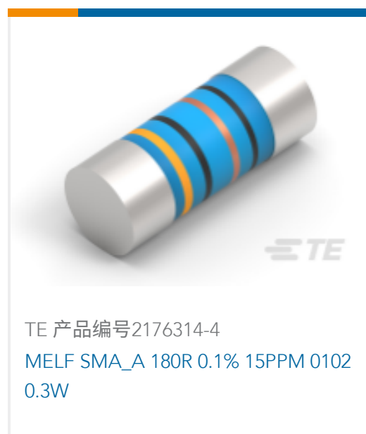
TE 产品编号2176314-4 MELF SMA_A 180R 0.1% 15PPM 0102 0.3W