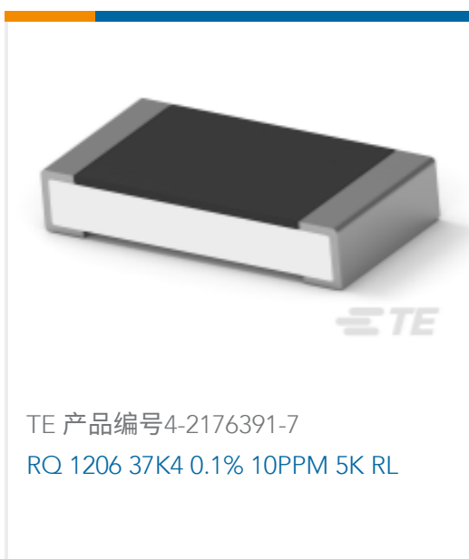
TE 产品编号4-2176391-7 RQ 1206 37K4 0.1% 10PPM 5K RL