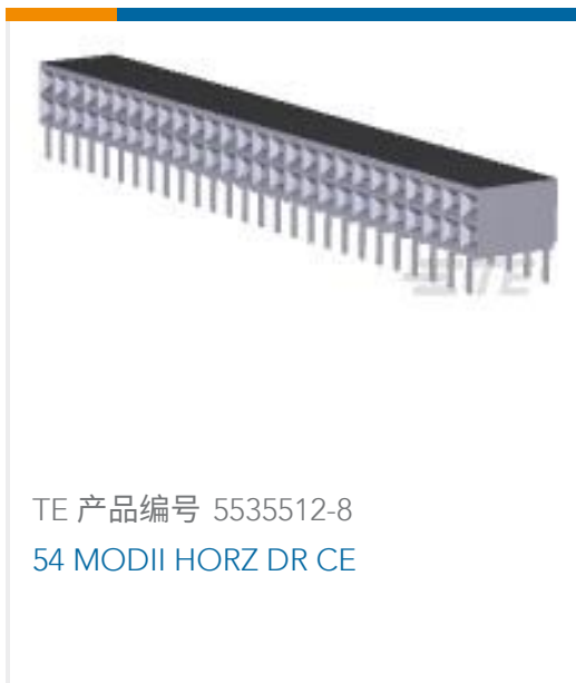
TE 产品编号 5535512-8 54 MODII HORZ DR CE