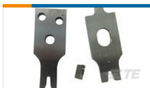
TE 产品编号7-2151981-7 OCEAN_2.0_SPARE_PART_KIT- 062F125O