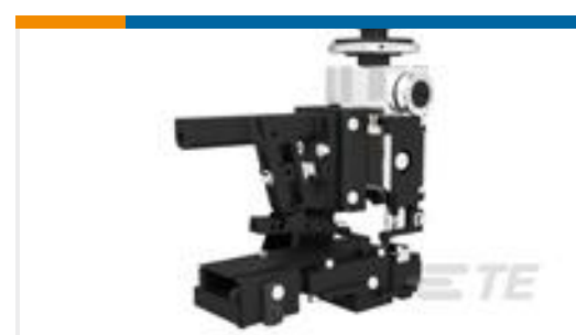
TE 产品编号2151981-1 OCEAN_2.0_APPLICATOR-S- 062F125O-RSM