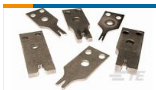
TE 产品编号1633963-1 CRIMPER, INSULATION OVERLAP PREMIUM