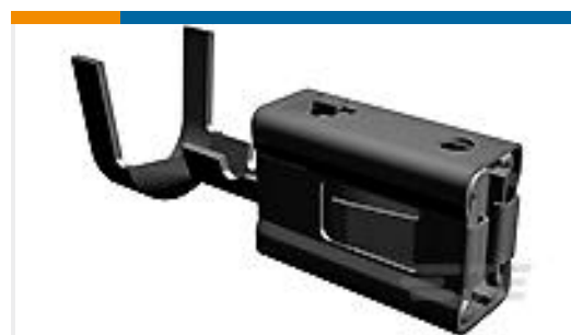
TE 产品编号1241415-1 AMP MCP 6.3/4.8K, CONTACT, SWS, (LP)