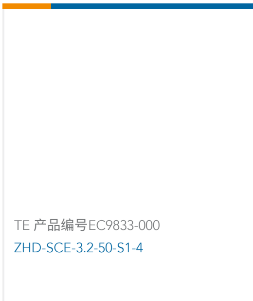
TE 产品编号EC9833-000 ZHD-SCE-3.2-50-S1-4