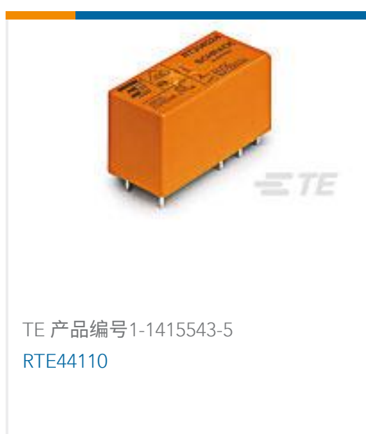
TE 产品编号1-1415543-5 RTE44110