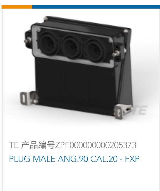
TE 产品编号ZPF000000000205373 PLUG MALE ANG.90 CAL.20 - FXP